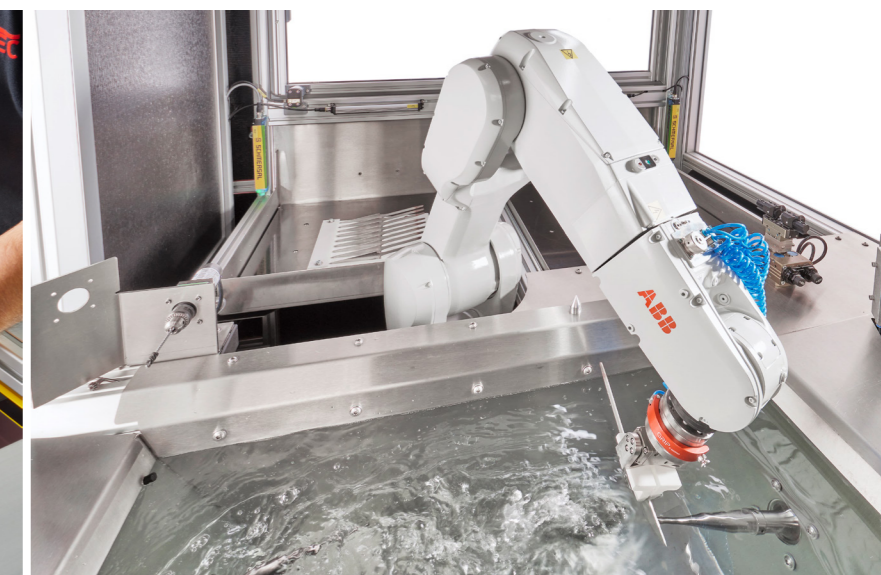
///// Entgraten von unterschiedlichen Materialien prozesssicher, vollautomatisiert und punktuell