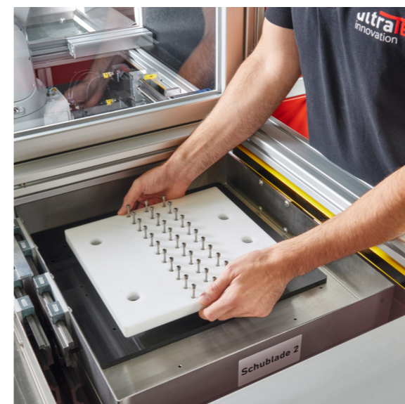
///// Automatisierung je nach Bedarf mit diversen Schubladensysteme